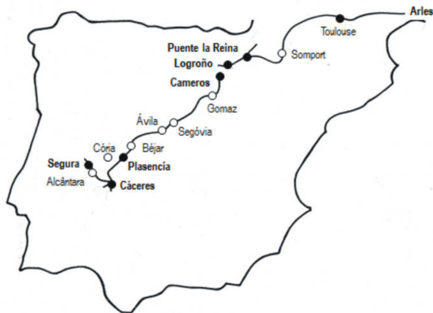
Figura 4. Itinerários ibéricos (século XIII)

pela portela de Santa Inês (1.750 m), próximo da nascente do Douro que transpunha em San Esteban de Gormaz. A partir daí, seguia ao longo cordilheira central que atravessava na portela de Béjar (932 m), depois de Segóvia e Ávila. Descia, então para Plasencia e Cáceres, terminando em Olivença. Em Cáceres, o Caminho Real cruzava a rota da via romana que ligava Mérida a Braga, passando por Alcântara e entrando em território