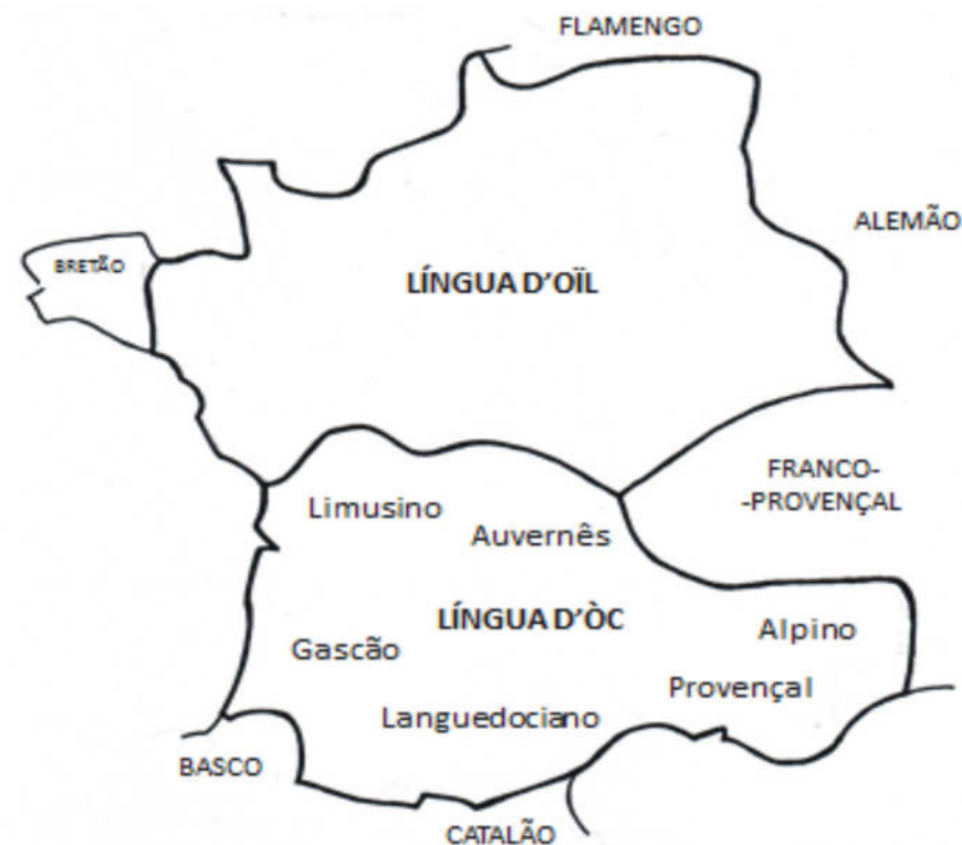
Figura 5. Língua d'Òc