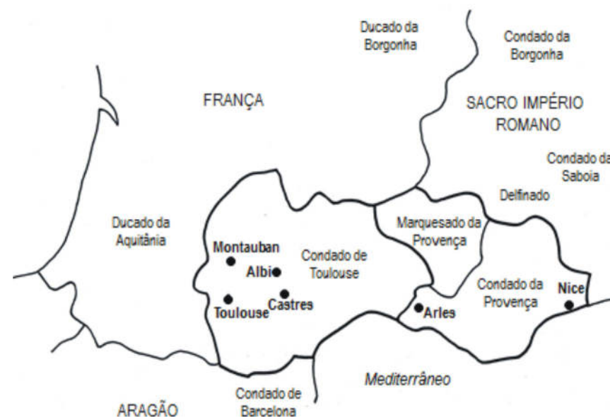
Figura 3. Sul de França em 1209

O condado de Toulouse, com origem no antigo reino da Aquitânia, no século VIII, sendo vassalo do rei de França, era então uma entidade completamente autónoma. Já a Provença, sob protecção do Sacro Império Romano, era essencialmente constituída pelo marquesado da Provença, da casa de Toulouse desde 1093, e pelo condado da Provença, da casa de Barcelona, posteriormente Aragão, desde 1112.