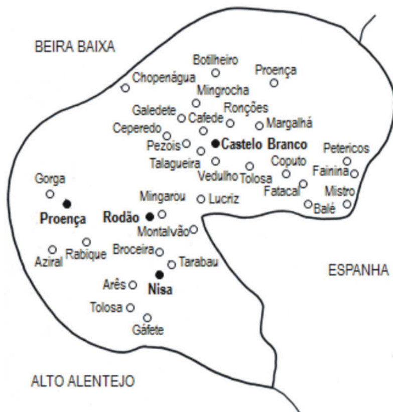
Figura 6. Topónimos occitejanos (Alto Tejo):localização

Na região do Alto Tejo há atualmente, pelo menos, outros trinta e sete topónimos que parecem igualmente poder resultar do povoamento occitano do século XIII.