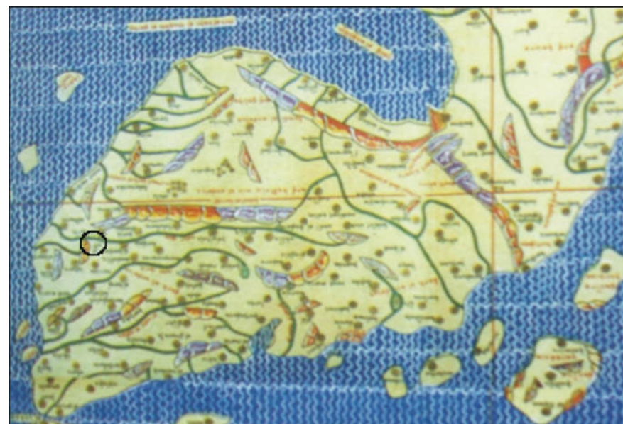
Figura 2. A Açafa na Península Ibérica de Al-Idrisi (1154)

Açafa é um topónimo com origem na palavra árabe as-saffa , com o significado de linha, fila, sebe, valado , que é um dos poucos onze topónimos do atual território de Portugal incluídos no mapa-mundo de Al-Idrisi, de 1154 (figura 2). O topónimo aparece registado junto ao Tejo, na zona em que o rio atravessa uma fila de montanhas actualmente conhecida como serra das Talhadas. Junto às Portas do Ródão desagua hoje no Tejo a ribeira do Açafal.