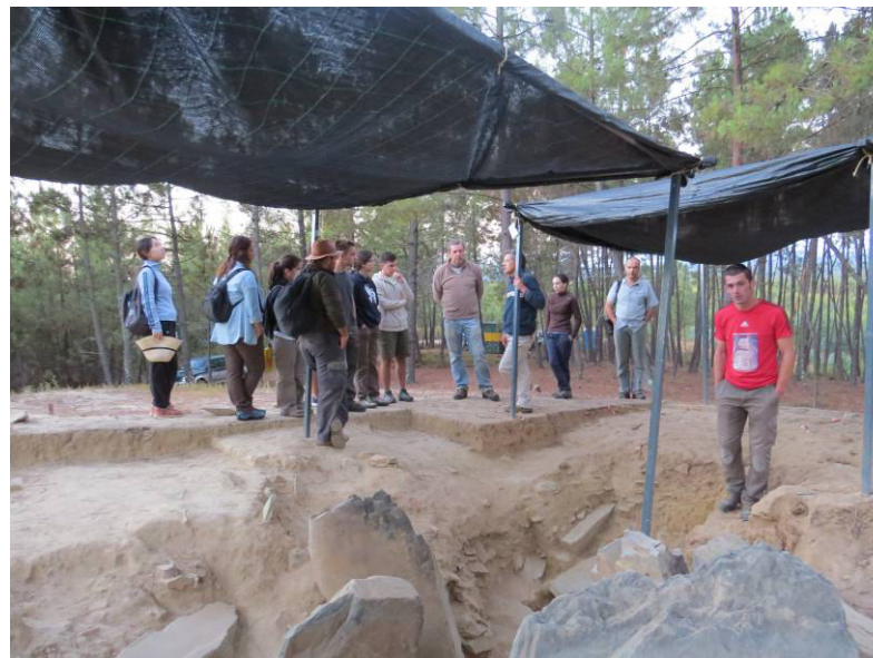
Início dos trabalhos no Cabeço da Anta.