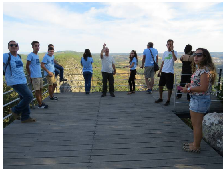
No miradouro das Portas de Ródão.