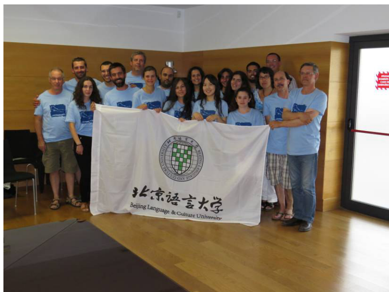
Participantes no CAPN.