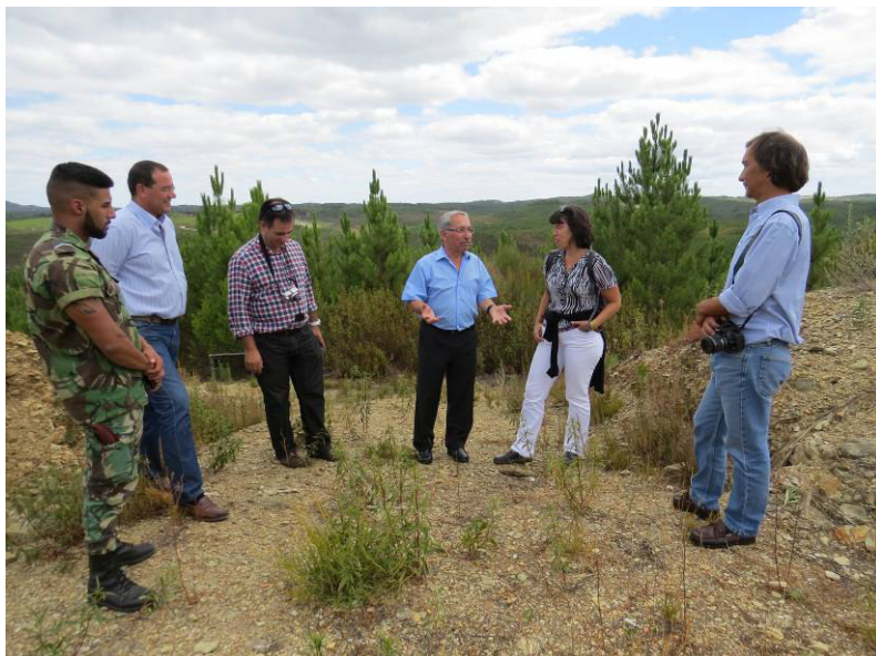
Visita de António Mascarenhas (general) ao Forte das Baterias.