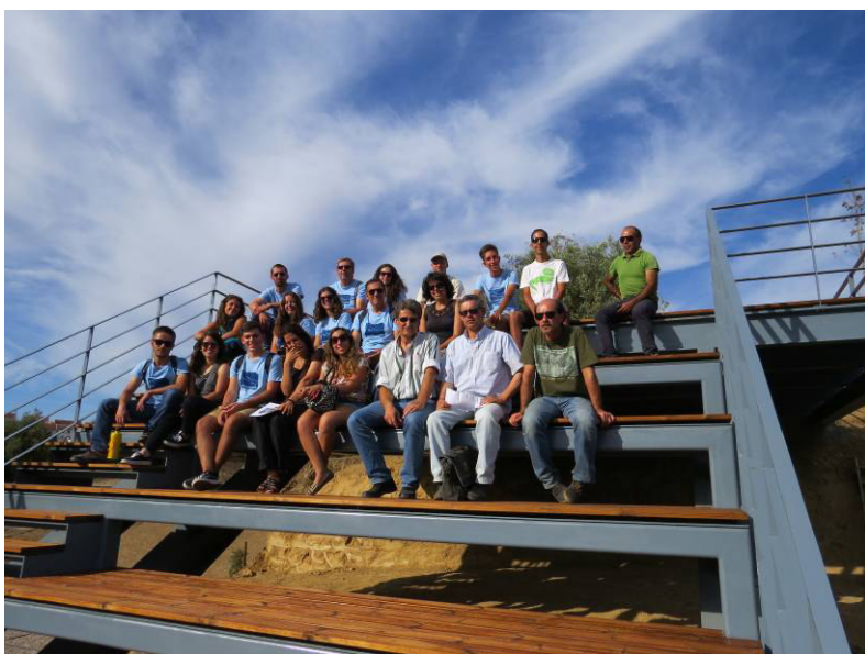
Visita à Foz do Enxarrique.