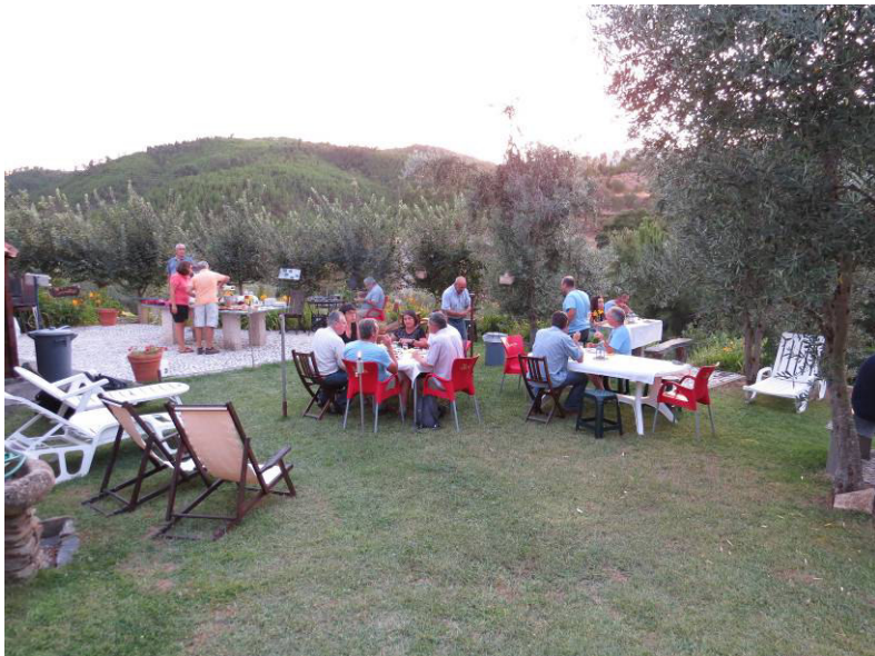
Jantar em aldeia de xisto (Oliveiras).