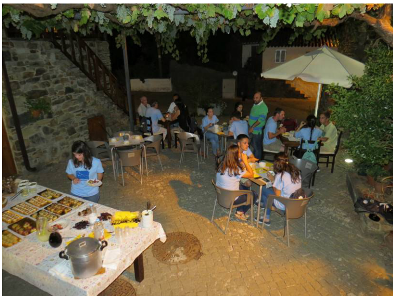
Confraternização em aldeia de xisto (Figueira).