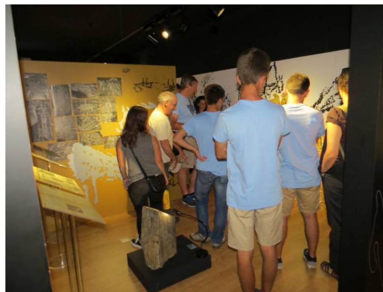
Visita ao Centro de Interpretação da Arte Rupestre do Tejo (V. V. de Ródão).