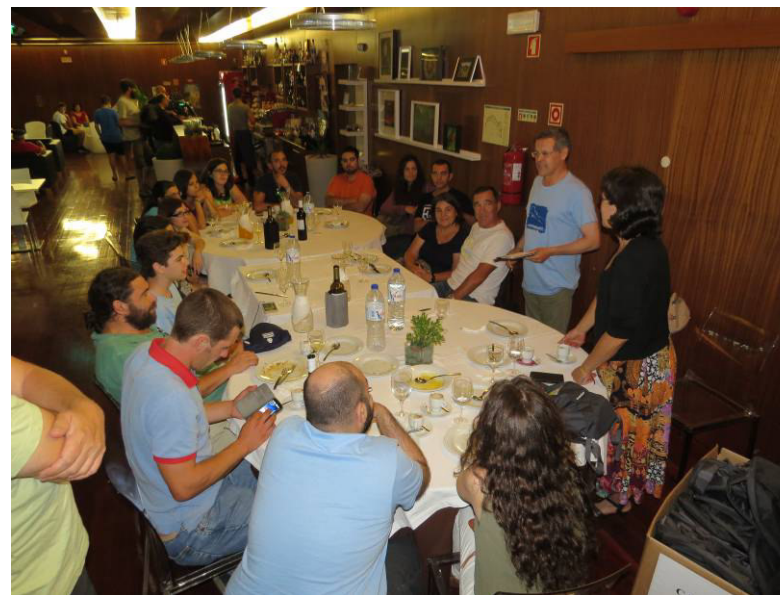
Encerramento do CAPN.