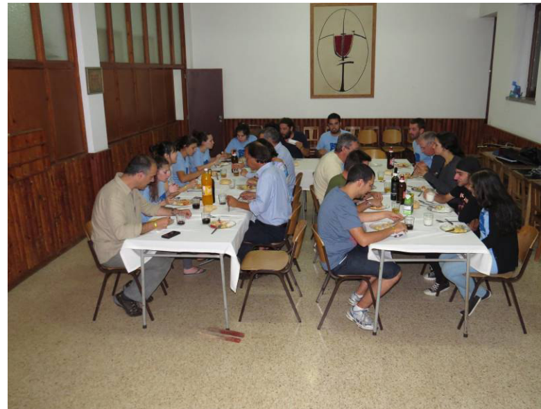
No Seminário do Preciosíssimo Sangue (alojamento dos participantes).