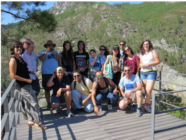
Participantes no miradouro das Portas do Almourão.