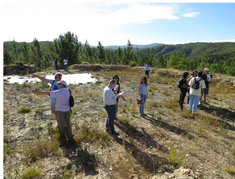
No Forte das baterias com António Correia.