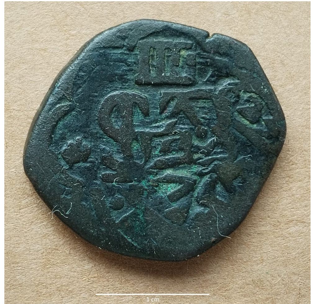
Figura 2. Moeda de Amarelos (escala centimétrica)