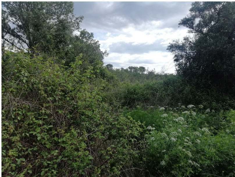
Figura 8. Aspeto atual do local do rombo existente na barragem, entre o troço ocidental e o intermédio

Contudo, é conhecida a abundância de vestígios romanos a sul, principalmente associados à exploração aurífera nos terraços do rio Tejo.