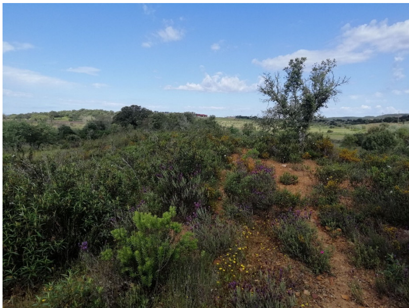
Figura 7. Aspeto do encontro oriental da barragem