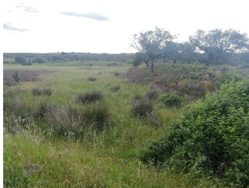
Figura 5. Aspeto da vertente norte da barragem (plano da antiga albufeira)