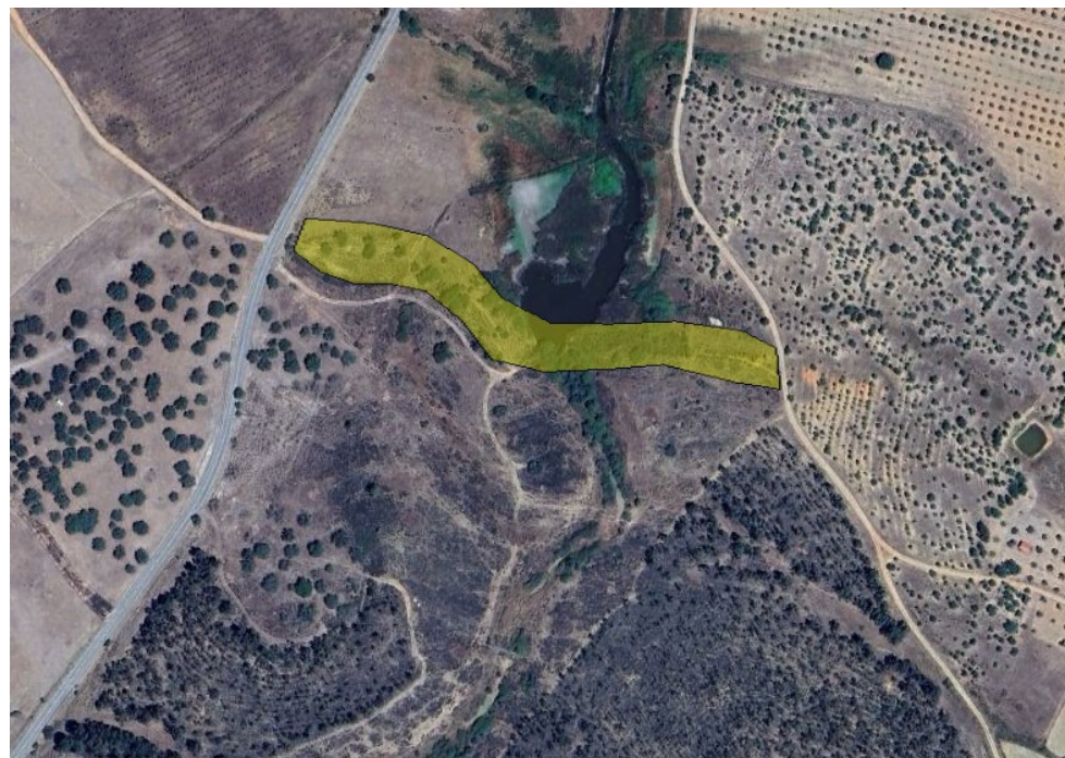
Figura 1. Localização da barragem da Lameira, sobre fotografia aérea.

Neste contexto, perante a existência de um projeto em curso destinado à instalação de um parque solar fotovoltaico, com alguma dimensão, na freguesia de Perais, e após verificação da implantação pretendida para o mesmo, o Município decidiu iniciar um procedimento com vista à classificação de um bem com singular importância, cuja localização próxima da área pretendida para o parque solar fazia, desde logo, antever a possibilidade de eventuais conflitos. Tratava-se da barragem romana da Lameira, uma das obras de maior monumentalidade do concelho, apesar da sua presença algo discreta na paisagem.