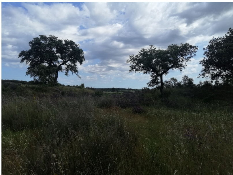
Figura 3. Aspeto da vertente sul da barragem, junto à E.N.553