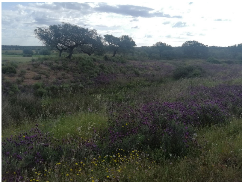
Figura 4. Outro aspeto da vertente sul da barragem (troço oeste)