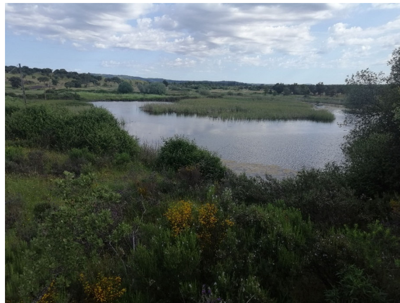
Figura 6. Plano de água existente