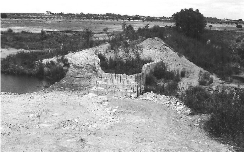
Figura 9. Aspeto do local do rombo existente, com a estrutura construída pela Câmara Municipal

perspetiva de utilização do território próximo ao monumento, com risco de intervenção ou atuação que resulte em algum tipo de degradação física ou visual.