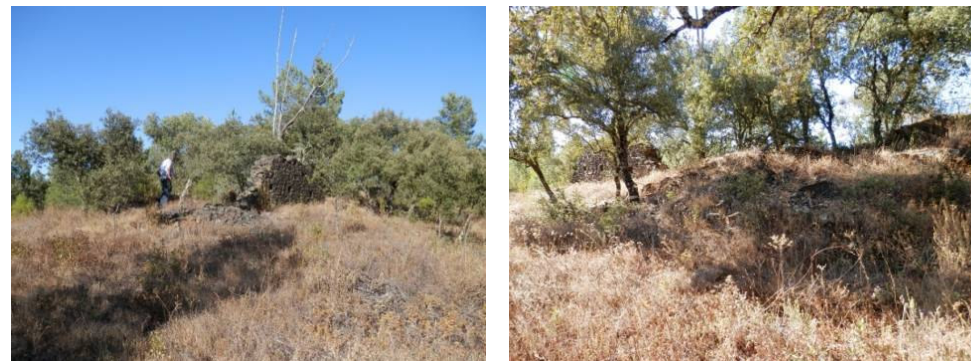
Figuras 1 e 2. Imagens do local em 2017, antes da limpeza do sítio em 2020.

xisto com aglutinante, e está muito arruinada, com derrubes no interior e no exterior. As paredes conservam-se a alturas muito diferenciadas. O seu estado de conservação não permite determinar o número de águas que teria a respetiva cobertura.