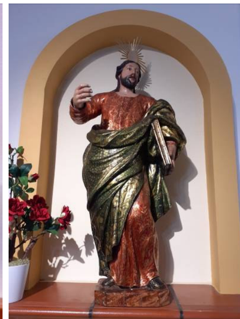
Figuras 8 e 9. Imagens de São Pedro e de São Tiago na actual igreja do Peral