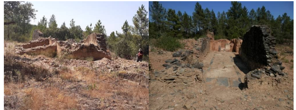
Figuras 4 e 5. Imagens do sítio após a limpeza (2020)

Tendo em atenção as alterações estruturais documentadas, concluímos que após a perda da sua função original, como templo, este edifício foi reutilizado, eventualmente como cemitério, como casa de habitação ou como curral para o gado. A hipótese da utilização profana é sugerida pela transformação da passagem, em arco, entre o altar-mor e a nave, numa porta estreita. Este espaço permanece propriedade da Fábrica da Igreja Paroquial de Proença-a-Nova e, segundo nos informaram, no passado teria abrangido uma área maior em redor do templo.