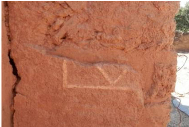
Figura 3. Motivo decorativo no altar lateral, da nave.

No reboco interior restam alguns centímetros de um motivo decorativo de tipo geométrico (Figura 3). A “limpeza” de vegetação e a remoção de derrubes colocaram à vista o chão de nave, seccionado, ao longo do seu comprimento, por três fiadas de placas de xisto, relativamente estreitas, configurando quatro espaços em terra batida, eventualmente para sepultamentos, e dois outros perpendiculares àqueles. Não é de excluir que sobre estas fiadas de placas de xisto assentasse o sobrado. Junto da entrada do templo existem três grandes lajes de xisto.