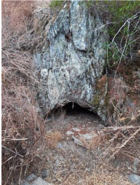
Figura 10. Buraco da Raposa